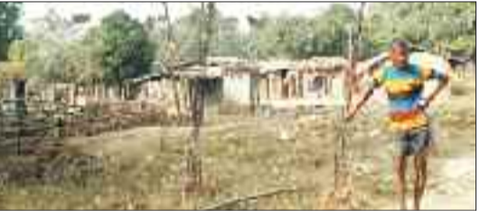
अपने अधूरे आवास के सामने खड़ा हितग्राही।

जमकर छाया रहा। उसकी हकीकत ग्रामीण अंचलों में देखने को मिलती है। ग्राम दूधीटांगर में केन्द्र सरकार की प्रधानमंत्री आवास योजना के तहत तीन पहाड़ी कोरवा हितग्राहियों को पीएम आवास के लिए पंचायत ने पात्र माना था, लेकिन तीन वर्ष बीत गए तीनों हितग्राहियों को अब तक आवास नहीं मिले। मामला ग्राम पंचायत बेला के अंतर्गत आने वाले आश्रित ग्राम दूधीटांगर बस्ती का है, जहां 8 घर पहाड़ी कोरवाओं के हैं। इनके लिए