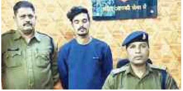
पुलिस गिरफ्तार में आरोपी।