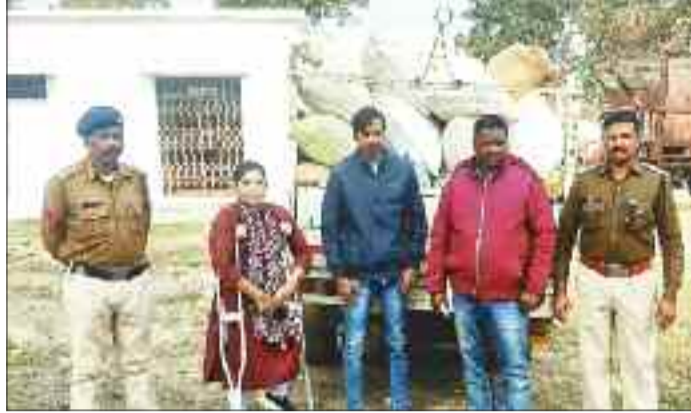
पुलिस गिरफ्तार में धान का अवैध परिवहन का आरोपी व जप्त वाहन।

पड़ोसी जिले से कोरबा जिले में धान की आवक न हो सके इसके लिए बैरियर लगाए जाने का प्रावधान है। कोरबा जिले का सीमा जांजगीर-चांपा, रायगढ़, पेंड्रा मरवाही, धरमजयगढ़, सकती, उदयपुर से लगी हुई है। लेकिन यहां आने वाले मुख्य मार्गों में कहीं भी बैरियर नजर नहीं आ रहे हैं और न ही नोडल अधिकारियों के द्वारा खरीदी केन्द्रों का सतत निगरानी नहीं किया जा रहा है। यही कारण है कि धान की आवक एकाएक बढ़ी है और मामले भी पकड़ में आने लगे हैं, किंतु इसके बावजूद भी जिला प्रशासन की